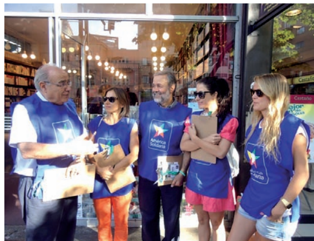
El equipo de Fundación América Solidaria lanzando campaña para captar nuevos socios, “No todo es bla -bla. Comienza a actuar”.