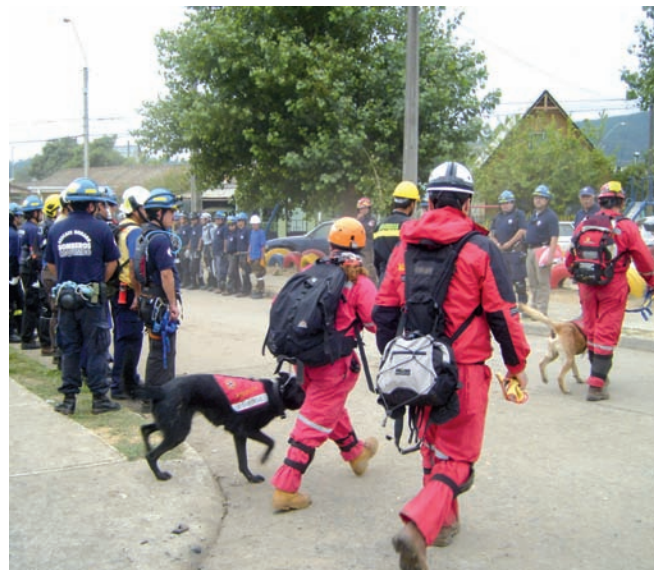
K-SAR Chile nace en febrero de 2003 de la idea de tres amigos adiestradores de perros, que tenían la inquietud de ayudar a la comunidad en la búsqueda de personas con ejemplares caninos.

Los interesados en participar en la institución pueden enviar a un correo a instrucción@ksarchile.cl .