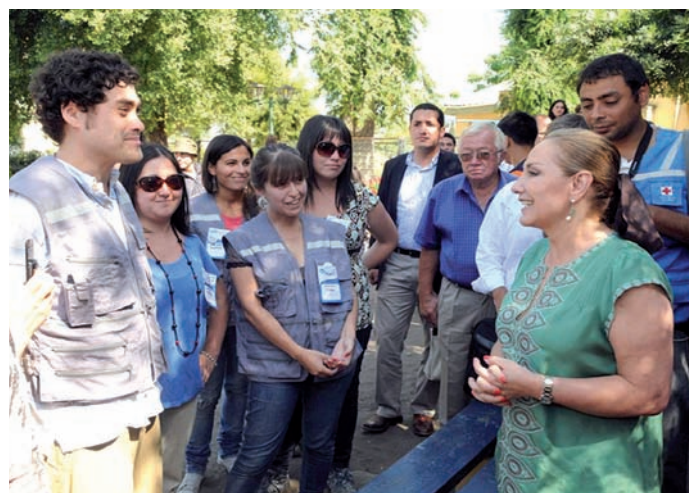
La Primera Dama, Cecilia Morel, junto a equipo de Psicólogos Voluntarios trabajando en la localidad de Quillón, Región del Bío Bío, tras los incendios forestales de enero pasado.

orientación para empresas y ha generado vínculos con ONEMI y la Red de Ayuda Humanitaria de Chile, con el objetivo de ayudar a un mayor número de personas.