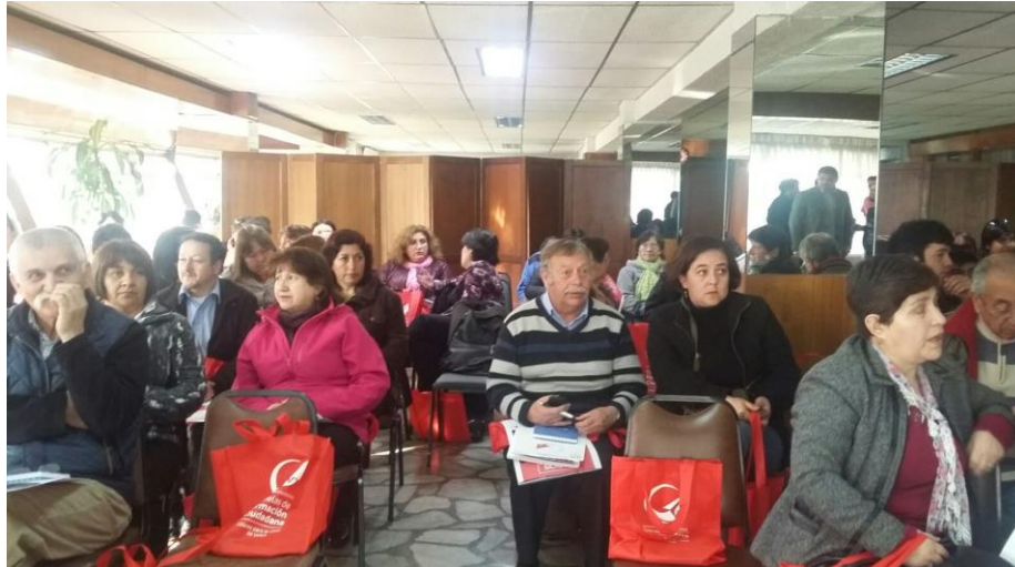
Dirigentes y Dirigentas de la Comuna de Temuco en Diálogo Participativo Ley 20.500 sobre Asociaciones y Participación Ciudadana en la Gestión Pública.