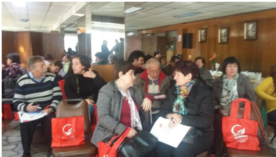
Dirigentes y Dirigentas de la Comuna de Temuco en Diálogo Participativo Ley 20.500 sobre Asociaciones y Participación Ciudadana en la Gestión Pública.