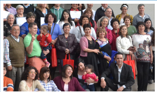
MASIVA CERTIFICACIÓN DE DIRIGENTES POR LA DIVERSIDAD