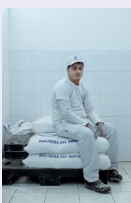
Cuarto lugar Fundación Coanil "EL pan de cada día" II Región