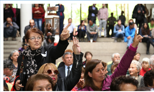
MUNICIPIOS NO PUEDEN EXCLUIR A ORGANIZACIONES COMUNITARIAS DE LOS COSOCS