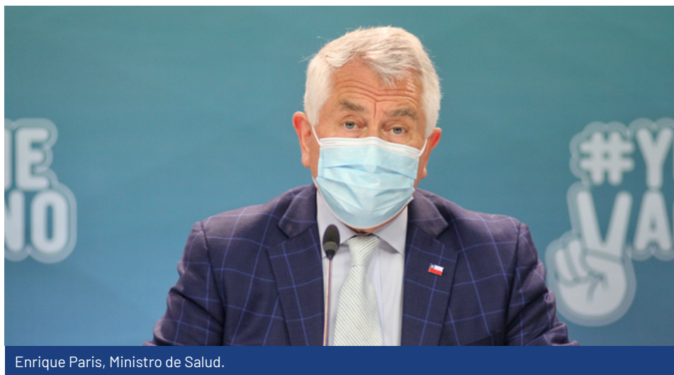
Enrique Paris, Ministro de Salud.

"Esto es un esfuerzo que hay que reconocer a la atención primaria y a los alcaldes, pero también al Estado de Chile", declaró el Ministro de Salud, Enrique Paris .