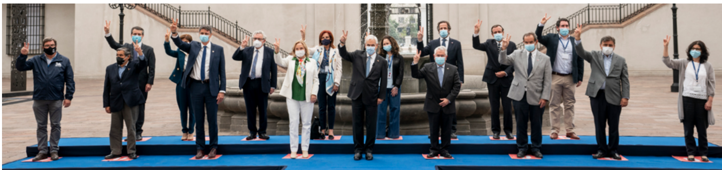
Presidente Sebastián Piñera, junto a diversas autoridades, durante el anuncio de los más de cinco millones de personas vacunadas.