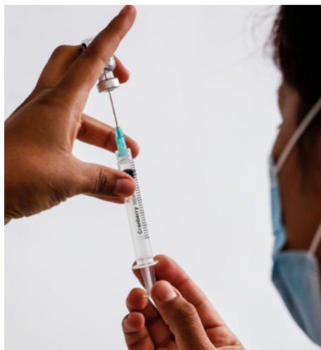
Personal médico preparando una dosis.

Grupos prioritarios para la vacunación durante el primer trimestre de 2021 a nivel nacional: