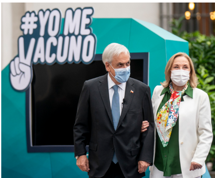
Presidente Sebastián Piñera, junto a la Primera Dama, Cecilia Morel.

“El 23 de diciembre compartimos con todos nuestros compatriotas las metas de nuestro país, porque no son las metas del Gobierno; son las metas de Chile en materia de vacunación. Vacunar a toda la población de riesgo, cinco millones de personas durante este primer trimestre. Este logro es mérito y pertenece a todos los chilenos”, sostuvo el Presidente, Sebastián Piñera , en el Palacio de La Moneda.