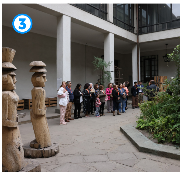
Patio de los Canelos

En tercer lugar, se continuaba con el Patio de los Canelos 7 , antes conocido como Patio de Invierno, destacaba por tener una gran cúpula de hierro y vidrio que protegía el espacio del frío y la lluvia. En términos históricos este lugar es relevante, dado que se puede visualizar el segundo piso de esta ala del Palacio, donde antes vivían los presidentes de Chile y existía una escalera que llevaba directo al Gabinete Presidencial. Así también, es posible dar cuenta de los cambios arquitectónicos que sufrió el Palacio, puesto que tras el bombardeo a la casa de gobierno el 11 de septiembre de 1973, esta cúpula fue totalmente destruida y no fue reconstruida.