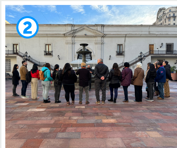
Patio de los Naranjos

En primer lugar, las personas ingresaron al Salón 100 5 , en donde se adaptó un espacio de una manera acogedora y amigable para dar inicio al Recorrido, y posteriormente realizar el Diálogo Participativo. En este punto se encontraban fotografías de la destrucción del Palacio y dos pendones con la historia de tres funcionarios de la entonces Secretaría General de Gobierno que fueron asesinados en dictadura, de los cuales, uno se encuentra aún en calidad jurídica de detenido desaparecido. Asimismo, se refiere al primer centro de detención y tortura durante la dictadura, ubicado en la Plaza de La Constitución, a metros del Palacio, el Cuartel N° 1 del Servicio de Inteligencia de Carabineros (SICAR).