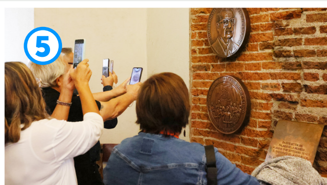
Memorial S. Allende

El quinto punto correspondió al Memorial Salvador Allende 9 . Aquí las personas apreciaban dos medallas en honor al presidente Salvador Allende, las cuales se pusieron ahí debido a la conmemoración de los 30 años del golpe de Estado civil y militar (2003). Además, donde se ubican las medallas se deja entrever una pared de ladrillos reconstruida y se enfatiza en la recuperación de espacios.