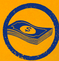
Dinero en efectivo