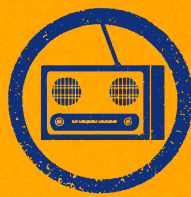
Radio a pilas