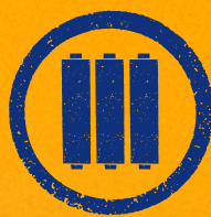
Baterías de repuesto