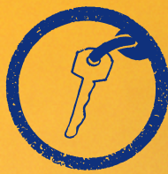
Llaves de repuesto de tu casa y auto