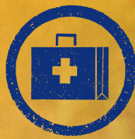
Botiquín de primeros auxilios